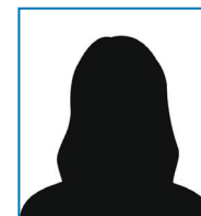
Aurélie BOUCARD BONNIN Conseillère municipale