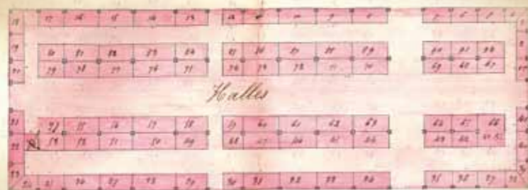
Numérotation des bancs sous les Halles en bois (1845)