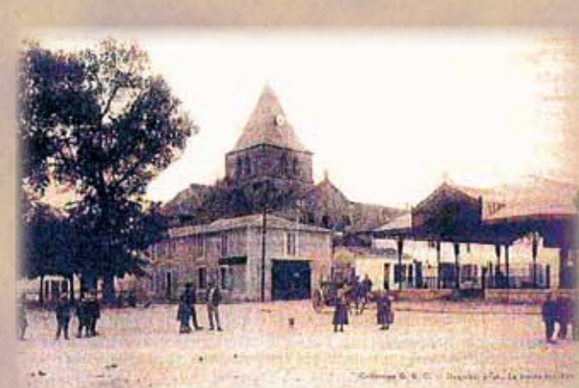
Le 13 juin 1903, sur les huit heures du matin, le Maire, Léopold GALLET appelle l'attention du conseil municipal sur le manque de solidité que semble offrir la façade de la mairie au dessus du porche servant de passage.

Extrait de la délibération en date du 8 Mars 1964