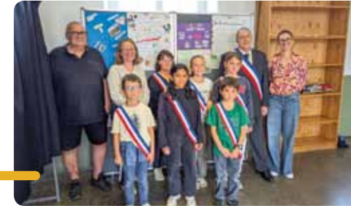
Les élus du CME pour l'École du Gois

Les élèves de CM1 et CM2 des deux écoles belvéris, l'École du Gois et l'École Saint-Joseph, ont élu, le 10 octobre dernier, leurs nouveaux représentants au sein du Conseil Municipal des Enfants pour l'année 2025-2026.