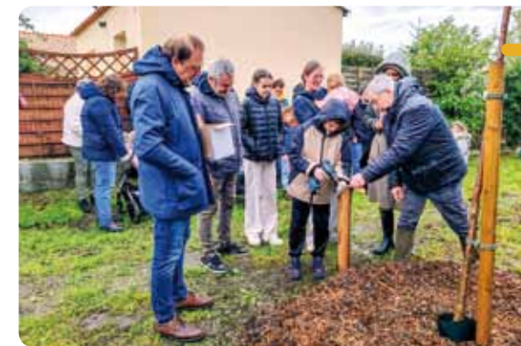
Les familles et les élus étaient présents pour célébrer cette quatrième opération.

À cette occasion, 13 nouveaux arbres ont été plantés le long de la sente douce reliant la rue du Stade au chemin de la Commanderie. Ces plantations viennent compléter les 10 arbres déjà mis en terre sur ce même secteur lors de l'édition précédente, participant ainsi à l'aménagement paysager et à la valorisation de ce nouvel espace.