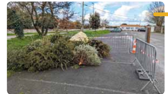
La zone de dépôt située sur le parking de la Maison des Associations.

La Municipalité remercie l'ensemble des habitants ayant participé à cette démarche et leur donne rendez-vous l'an prochain pour une nouvelle édition.