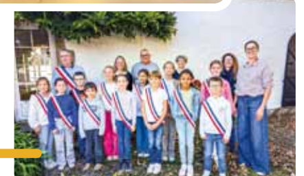
Toute l'équipe du CME est motivée et prête à l'action pour cette année