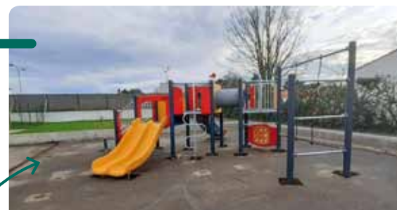
Installation d'un module de jeux à l'école maternelle du Gais