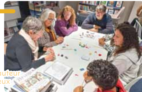
soirée auteur de jeux