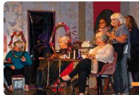
Les comédiennes à l'occasion de la représentation de « Coiffure pour dames ».

Réservation : 07 86 94 75 71 / 06 58 38 24 91