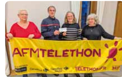
En haut : les participants à la balade pédestre. En bas : des membres du Comité belvérisien du Téléthon, ravis de la somme récoltée.