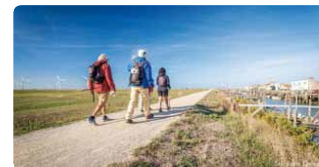
Des personnes pratiquant la randonnée sur le territoire de Challans Gois Communauté