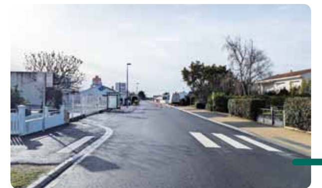
La voirie et les trottoirs de la rue des Sables, récemment rénovés.

Le Département est intervenu en fin d'opération pour refaire le tapis d'enrobé et ainsi finaliser l'aménagement de cette portion de la rue des Sables.