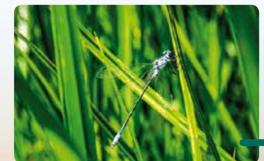
Leste à grands stigmas.