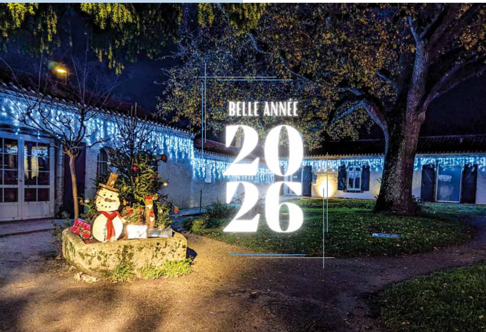
L'Ardoise Verte décorée pour les fêtes de fin d'année.