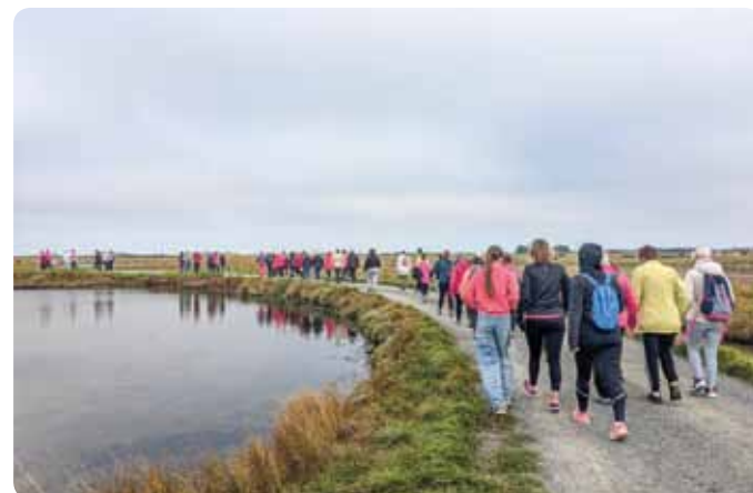
Les participants au départ et pendant la marche « La Belvéline ». Près de 180 marcheurs réunis pour soutenir la cause d'Octobre Rose.