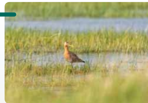
Barge à queue noire.

En revanche, aucun stationnement n'est possible sur place et l'accès aux parcelles est strictement interdit , celles-ci étant réservées aux ayants droit.