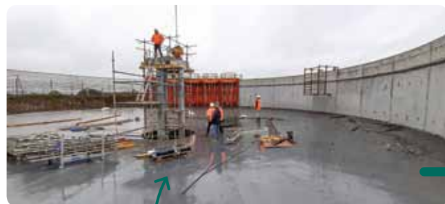
Suite des travaux de création d'un bassin tampon pour la station d'épuration