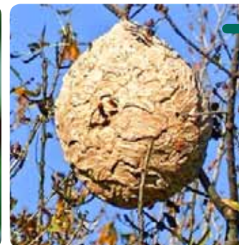
Un frelon asiatique ainsi que son nid.