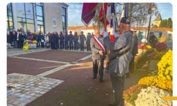
La cérémonie du 11 novembre autour du Monument aux morts, sur le parvis de l'Hôtel de Ville.

Le 5 décembre , une seconde cérémonie a été consacrée à la mémoire des soldats morts pour la France durant la guerre d'Algérie ainsi que lors des combats du Maroc et de la Tunisie.