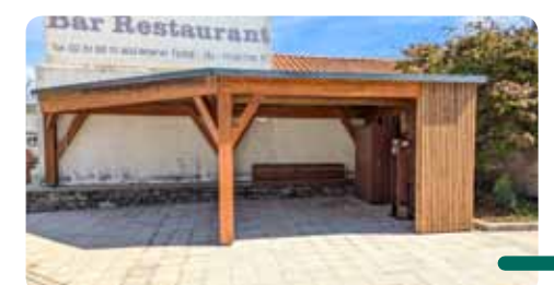
Halte vélos située place des 3 Alexandre.