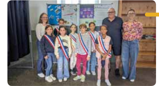
Les élus du CME pour l'École Saint-Joseph