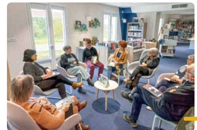
Les participants à l'occasion d'un précédent café des lecteurs.

Autant d'occasions de partager des moments de découverte, d'échanges et de plaisir autour de la lecture et du jeu.