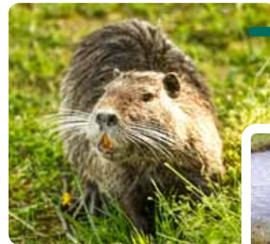
Ragondin dans le Marais.