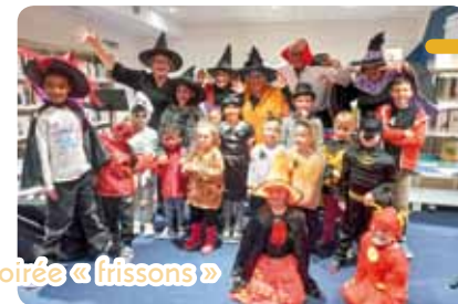
soirée « frissons »