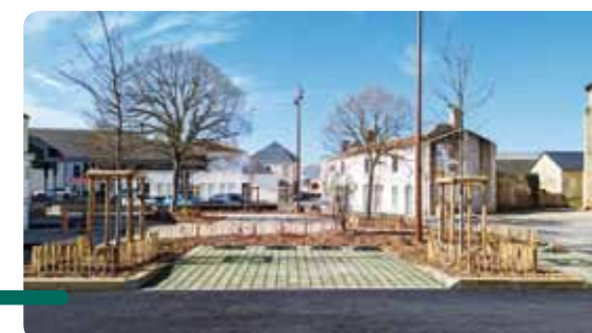
Stationnement sur la Grand Place.