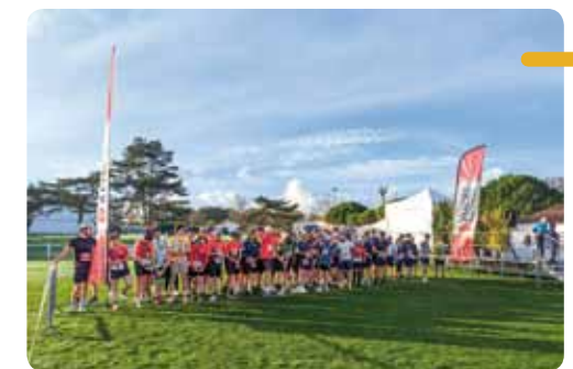
En haut : un binôme arpentant un chemin boisé du parcours. En bas : une partie des concurrents au départ.