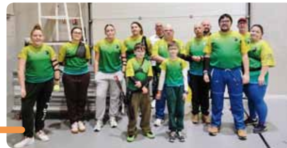
Des archères et archers du club belvéroin.

Le LAPG vous présente ses meilleurs vœux pour cette nouvelle année.