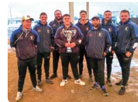
L'équipe séniors championne régionale.

Ce titre permet à nos champions d'accéder au CRC 1 ère division. Bravo à eux.