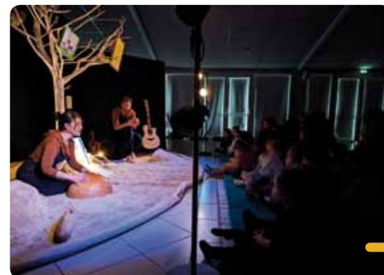
Le spectacle proposé par la compagnie La Roue Tourne a offert un voyage à travers les saisons.