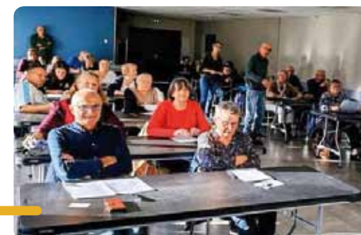
Les participants installés dans la Salle Sirocco.

L'ambiance, studieuse mais conviviale, a conquis les amateurs de langue française, ravis de se prêter au jeu et de retrouver l'esprit des dictées d'antan.