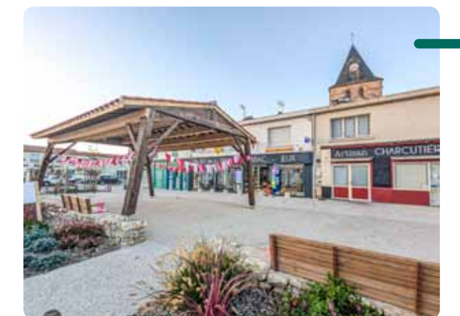
Préau installé sur la Grand Place fraîchement rénovée.

Cette opération comprendra la réfection des trottoirs et de la chaussée, dans la continuité des cheminements réalisés. La placette à l'entrée de la rue de la Butte sera également refaite.