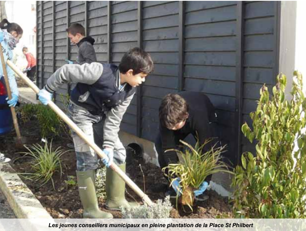
Les jeunes conseillers municipaux en pleine plantation de la Place St Philbert