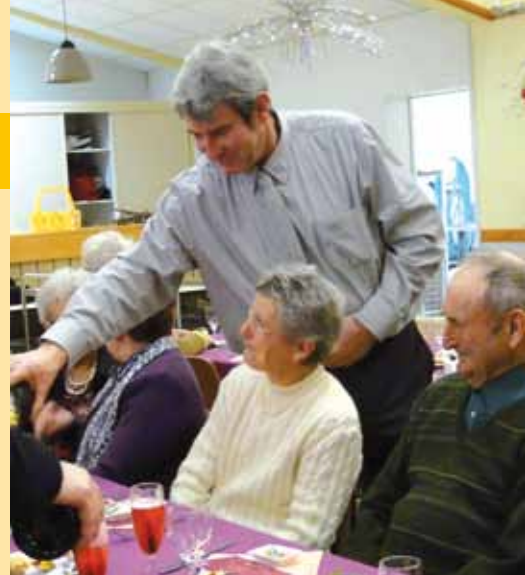
Monsieur le Maire sert l'apéritif