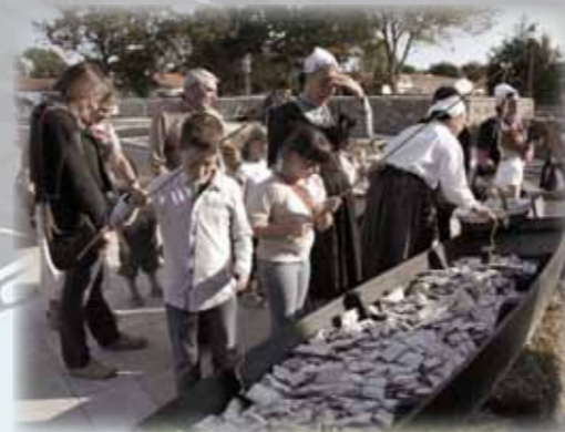
La pêche à la ligne a fait des ravis !