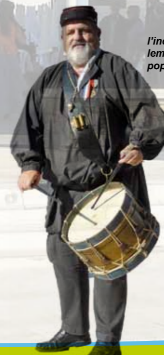
l'incoutournable garde-champêtre était également présent pour déclamer les «Avis à la population»

Les festivités autour des Halles se sont clôturées avec la distribution d'un livret retraçant l'histoire des Halles auprès de toutes les familles belvérides.