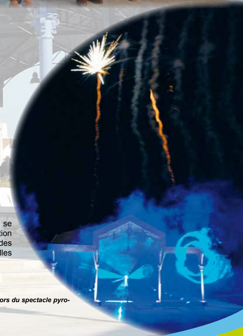
Le cœur des Halles lors du spectacle pyrotechnique

Les festivités autour des Halles se sont clôturées avec la distribution d'un livret retraçant l'histoire des Halles auprès de toutes les familles belvérides.