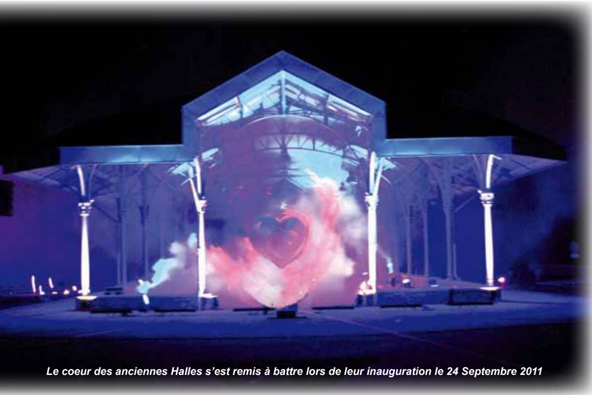
Le coeur des anciennes Halles s'est remis à battre lors de leur inauguration le 24 Septembre 2011