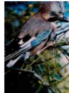
Geai des chênes Parc du Cornoir

41 villes de la région conservent leurs deux fleurs et 4 autres obtiennent quant à elles la troisième fleur.