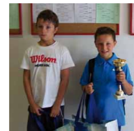
Vainqueurs et finalistes 9/10 ans du tournoi de Juillet 2014