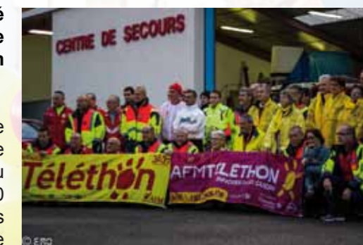
Pompiers et bénévoles au départ de la course départementale des Sapeurs Pompiers au profit du Téléthon

Chaque année, une vingtaine d'associations belvérides se mobilise pour répondre présente au rendez-vous du Téléthon : 1210 croissants distribués à domicile, ventes diverses, lâcher de ballons, randonnée pédestre, dons... Tous les fonds recueillis sont reversés à l'AFM Téléthon pour notamment financer des projets de recherche sur les maladies génétiques parfois rares.