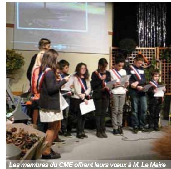
Les membres du CME offrent leurs vœux à M. Le Maire