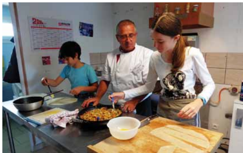
L'Outil en main, la transmission du savoir et du tour de main

Pour tous renseignements appeler le 02 51 68 70 86 ou le 02 51 68 68 66. La cotisation est de 70,50 € par an, assurance comprise.