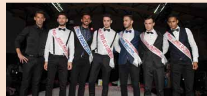
Élection Modèle Éléance Pays de La Loire - Beauvoir - 22 nov 2014

Ajouter 25% pour les enfants et jeunes habitant hors du canton.