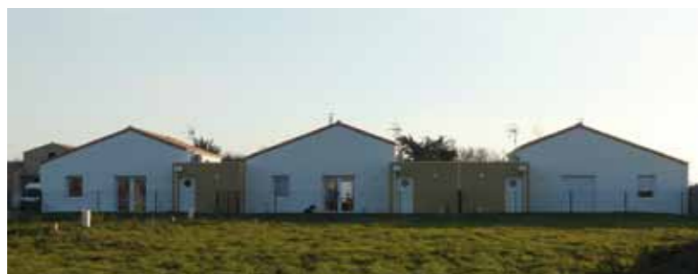
Remise des clés aux locataires le 3 Novembre dernier