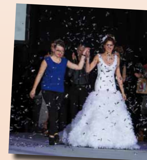
Trophée des jeunes créateurs de mode Beauvoir sur Mer - 22 nov 2014