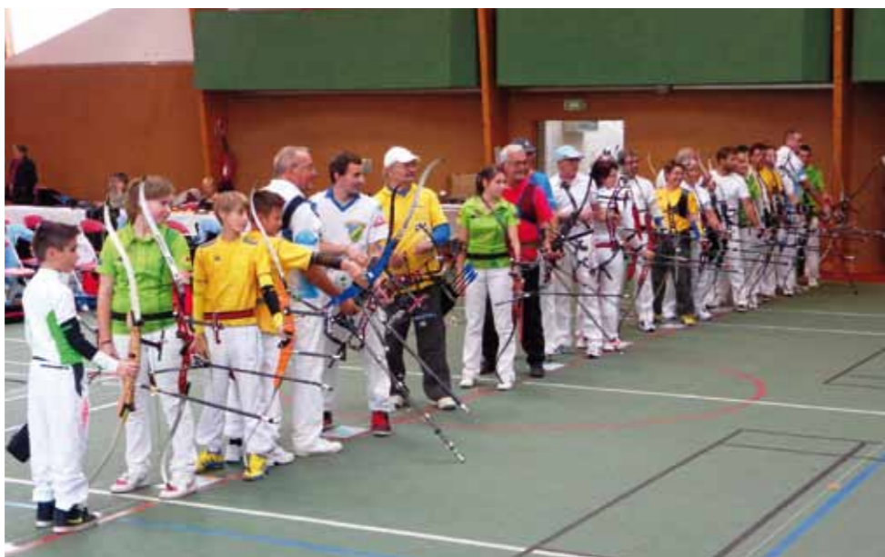
Une belle ligne d'archers, jeunes et vétérans confondus

«Les Archers du Marais» remercient la municipalité de Beauvoir, les commerçants et artisans du canton de Beauvoir qui les ont efficacement soutenus pour cette journée, ainsi que la municipalité de Saint Gervais qui prêtait sa salle de sport à cette occasion, sans oublier le Conseil Général, toujours présent tout au long de l'année.