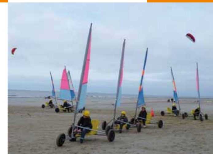
Sortie Char à voile

N'hésitez pas à consulter notre site internet pour vous informer en temps réel : www.beauvoir.wix.com/office_enfance_jeunesse