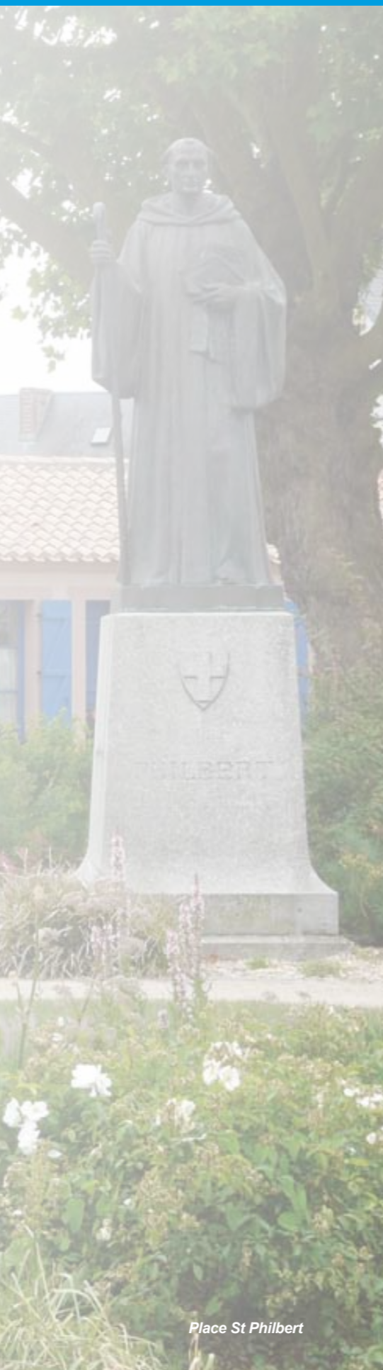
Place St Philbert

Le Conseil municipal, après en avoir délibéré : - décide de poursuivre le projet de réalisation d'une voie reliant la Route de la Roche à la Zone Artisanale du Clos St Antoine afin de faciliter l'accès à la zone par la création d'une voie adaptée aux poids lourds et d'éviter le passage de ces véhicules sur le Chemin de la Chèvre. - décide dans ce cadre d'étudier toutes les opportunités permettant de réaliser ce projet d'intérêt général, notamment sur les parcelles cadastrées section AN n°32, 33, 35, 36 et 37, AR n°22 et 26b, et AP n°59, 63, 64 et 65 situées en bordure du Chemin du Fief Robert, dont le tracé servira de base à la future voie.