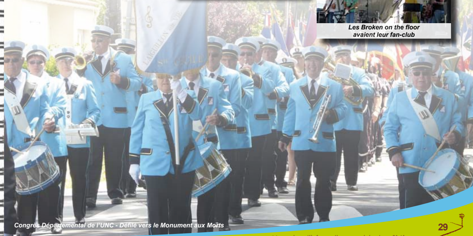
Congrès Départemental de l'UNC - Défilé vers le Monument aux Morts