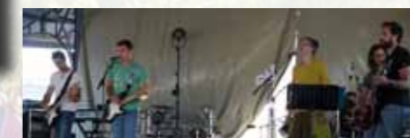
Les Broken on the floor avaient leur fan-club