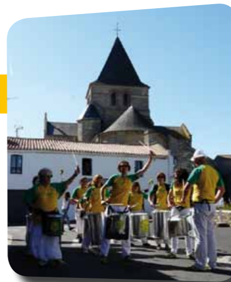
Les percussionnistes d'Onda Da Bahia ont confirmé l'arrivée de l'été

Centre Régional Opérationnel de Surveillance et de Sauvetage Tél : 02 97 55 35 35 1616 depuis un mobile