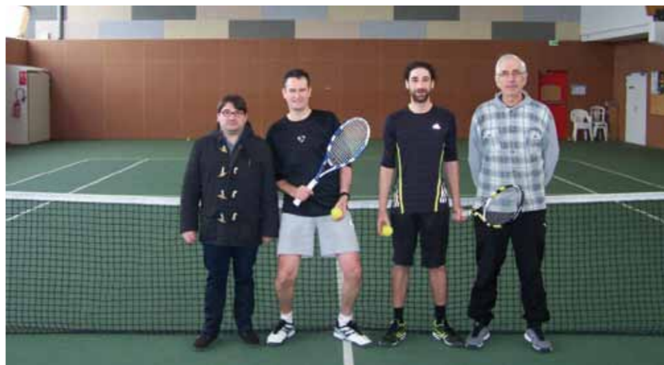
Les finalistes du tournoi interne avec le président et le vice-président