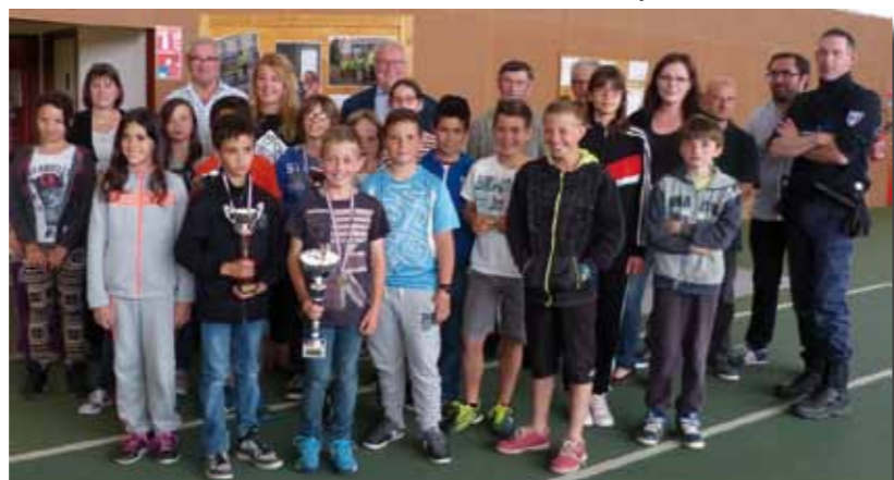
Ci-dessous, les candidats et organisateurs de la finale intercommunale de la prévention routière