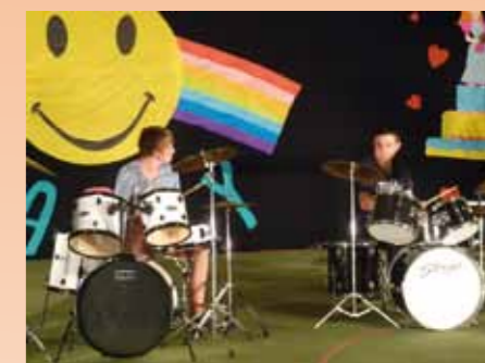
Concert de la section musique au gala du 12 juin