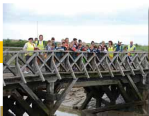
Journée inter-CME à la découverte du patrimoine belvérois

Les élus adultes sont ravis d'avoir partagé cette nouvelle année avec les enfants et sont fiers de leur bon comportement notamment à l'occasion des cérémonies.