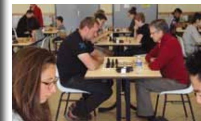
Le championnat de la ligue Pays de Loire