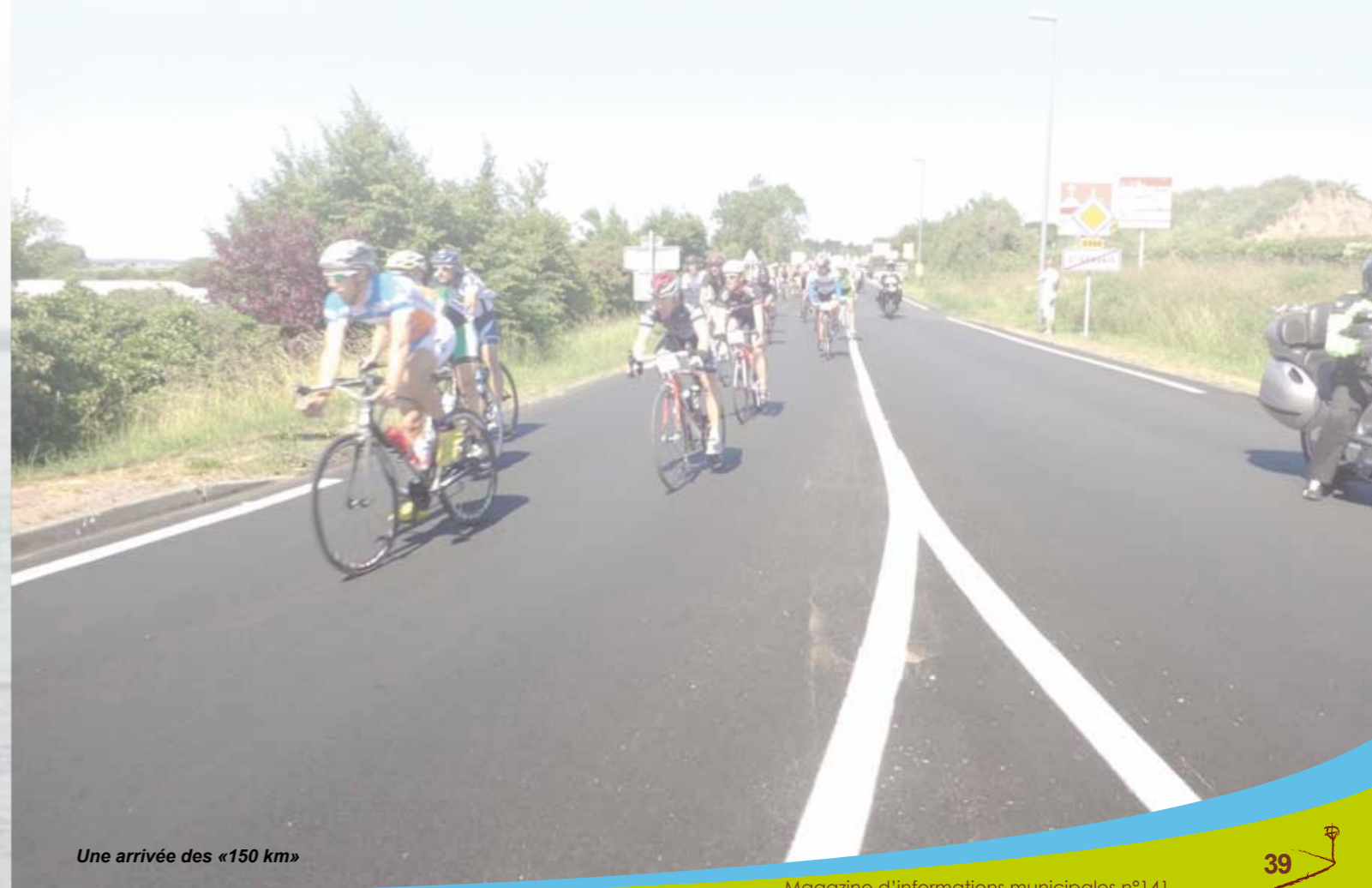
Une arrivée des «150 km»

randonnées dans la région dont certaines très réputées, la journée a été un succès : Plus de 325 cyclistes (60 sur le 150 km, 160 sur le 110 km, 65 sur le 73 km, 40 sur le 40 km) et une centaine de marcheurs sur les trois circuits . L'arrivée de tous ces parcours avait lieu au Haras des Presnes ou un repas attendait les participants. Les bénéfices de cette journée (qui n'étaient pas encore établis) seront versés aux associations des Brûlés de France et diabétiques lors d'une petite réunion entre les organisateurs et les associations susdites.