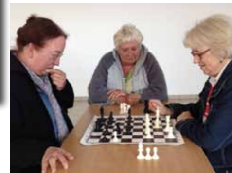
et les moins jeunes...

Mais déjà, il nous faut préparer le «2°rapide du Gois» qui se déroulera le dimanche 20 septembre à la salle polyvalente. Par avance, nous invitons les Belvéryns curieux, intéressés ou initiés à venir assister un moment à cette fête des échecs.