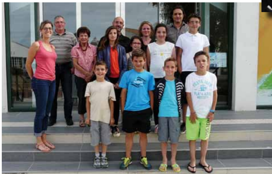
Le CME lors de son assemblée plénière en juin 2015

Les membres du 14 ème Conseil Municipal des Enfants, entourés des élus «adultes» et de l'Office Enfance Jeunesse, se sont réunis lundi 22 juin pour conclure leur année de travail.