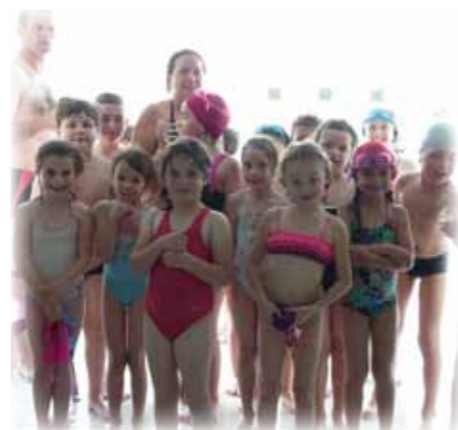
Les plaisirs aquatiques pour la dernière période de TAP

À l'occasion de la dernière séance de TAP le 3 juillet dernier, la municipalité a remercié tous les bénévoles qui sont venus aider et partager leur savoir-faire auprès des enfants.