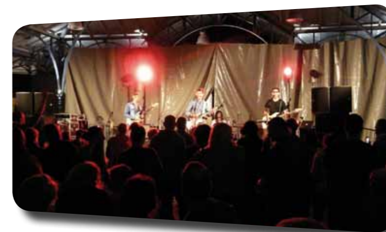
Le groupe «The ones» nous a fait découvrir les titres de son nouveau CD