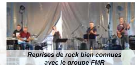
Reprises de rock bien connues avec le groupe FMR

Plus de 3000 personnes étaient présentes dimanche 21 juin à Beauvoir sur Mer à l'occasion du Congrès Départemental de l'UNC (Union Nationale des Combattants) organisé par la section UNC de Beauvoir avec l'aide de la municipalité et des sections voisines. Autorités militaires, préfecturales et élus étaient présents. Près de 500 drapeaux d'anciens combattants flottaient dans un ciel bleu et ensoleillé.