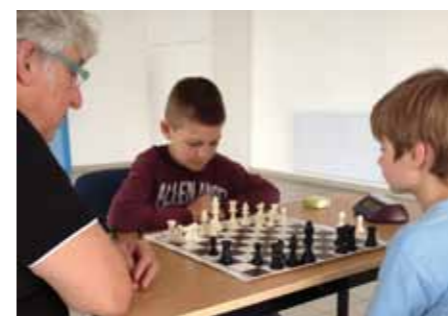
Ambiance studieuse le mercredi avec les jeunes...

Pour la première fois, une équipe était engagée dans le championnat départemental et termine honorablement en milieu de tableau.