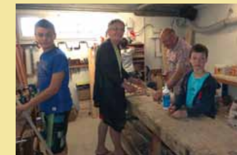
Portes ouvertes à l'Outil en main

Pour tous renseignements ou inscriptions, appelez le 06 16 66 30 68.