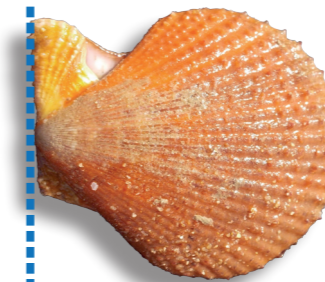
Pétoncle 4 cm / 2 kg ~ 65 pétoncles