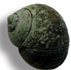
Bigorneau 3 kg ~ 500 bigorneaux