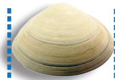
Spisule / Vénus 2,8 cm / 3 kg