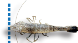
Autres crevettes 3 cm