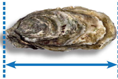
Huître 5 cm / 60 huîtres dans la limite de 5 kg