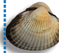
Coque 2,7 cm / 4 kg ~ 400 coques (Sauf gisement de La Baule 3cm)