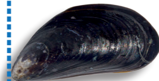
Moule 4 cm / 5 kg ~ 500 moules