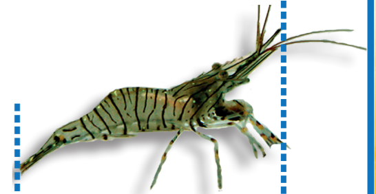
Crevette bouquet 5 cm